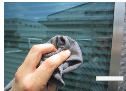
⑥布きれで残った糊を拭き取る 家具用合成洗剤 で少し濡れている 間にこすると取り易い感じです