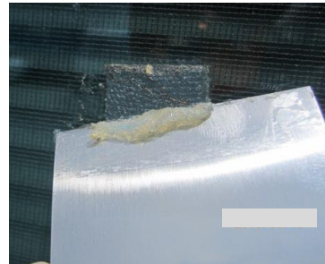
③ヘラで一度欠き取る 少し暖かい時、糊が柔らかくな り取れやすいです

ヘラを強くこするとガラスが傷つく恐れがあります。 まっすぐゆっくり動かしてください