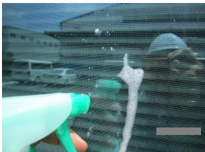
④家具用合成洗剤を掛ける

ヘラを強くこするとガラスが傷つく恐れがあります。 まっすぐゆっくり動かしてください