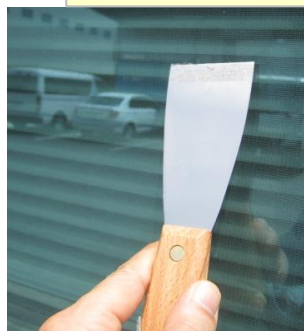
⑤ヘラで残った糊を こすり落とす