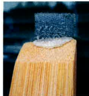
③ヘラで一度欠き取る