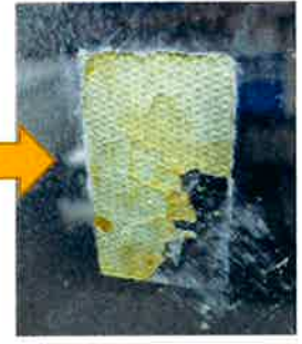
③ヘラで欠き取る。 糊の端にヘラを何度かぶつけるように強く押し当てると、糊が碎けます) 日が当たらない時間だと糊が固まって取り易い