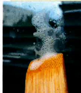
⑤ヘラで残った糊を こすり落とす