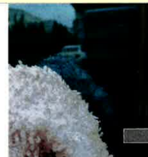
⑥布きれで残った糊を拭き取る 家具用合成洗剤 で少し濡れている 間にこすると取り易い感じです