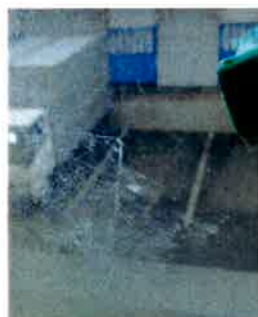
④家具用洗剤を掛ける