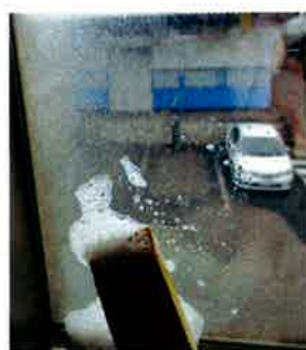
⑤ヘラで残った糊をこすり落とす