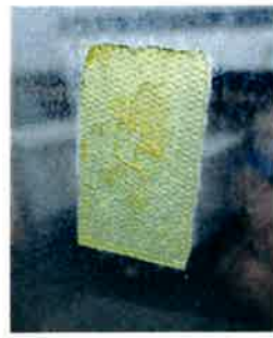
②糊残り(乾いて固い)