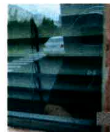
⑧布切れで仕上げて出来上がり

※家具用合成洗剤でも取れない時 ドライヤーで温めるか、最小限 の強力粘着剤はがしを使う。(糊 が溶けます)