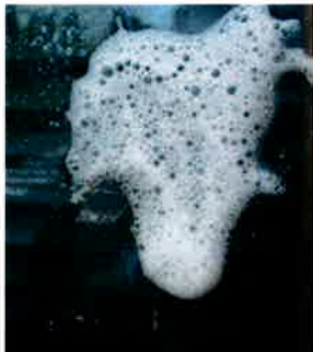
④家具用合成洗剤を掛ける

ヘラを強くこするとガラスが傷つく恐れがあります。 まっすぐゆっくり動かしてください