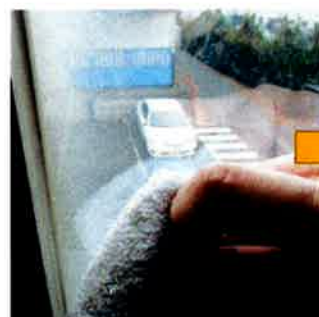
⑥布きれで残った糊を拭き取って仕上がります