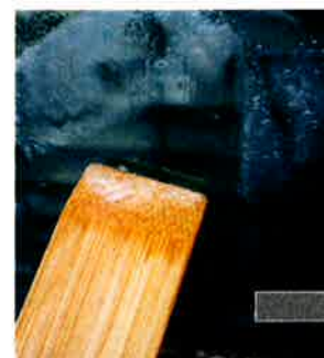
⑦竹ヘラでこすり糊を溶 かします